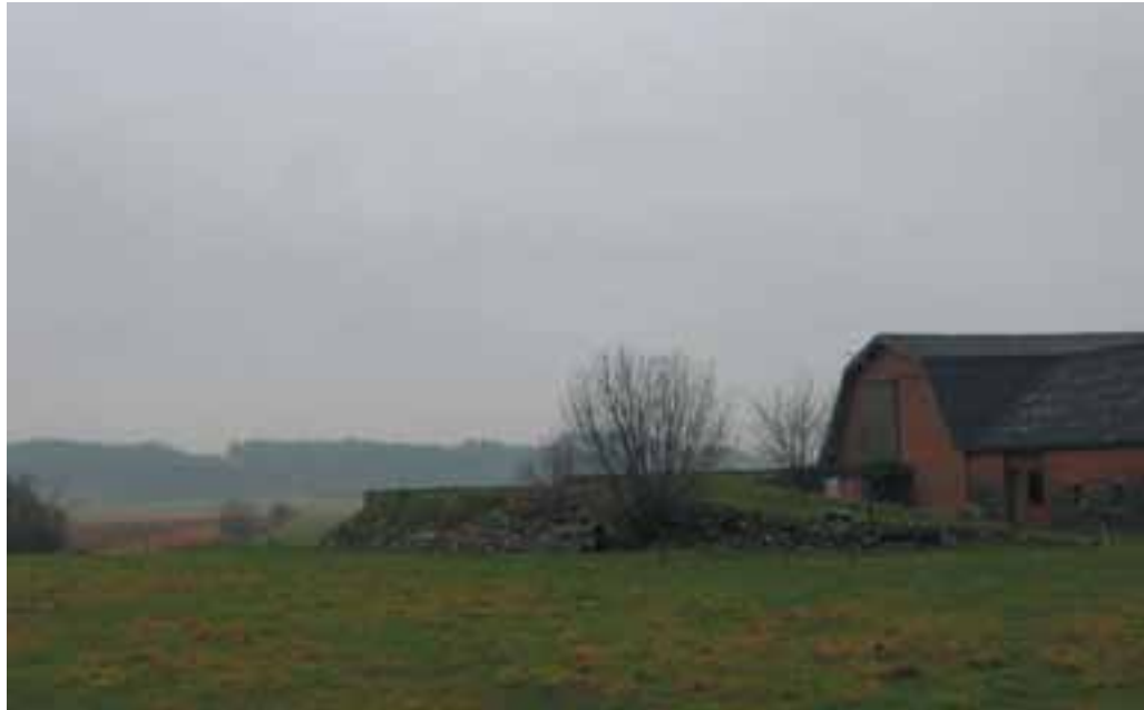
Karakteristisk udsigt over ådalen fra bygaden. De mange åbne kig er et bevaringsværdigt karaktertræk.