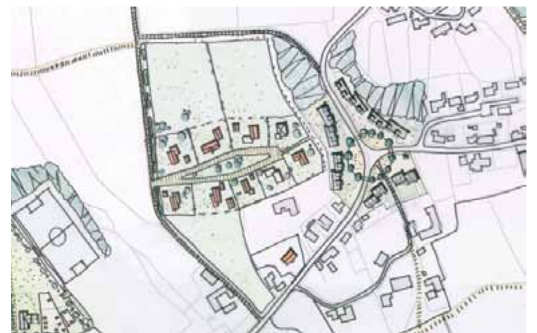
Forslag til udnyttelse af området nord for Låstrupvej 21-23.