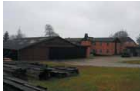
Del af savværket i dag

Der er skitseret en model med parcelhuse og jordbrugsparcer. Idéen er, at bebyggelsen