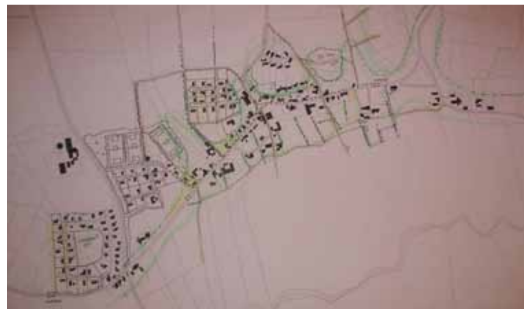
Bruttoplanen, der blev præsenteret på aftenmødet. Den endelige plan afviger på flere punkter.