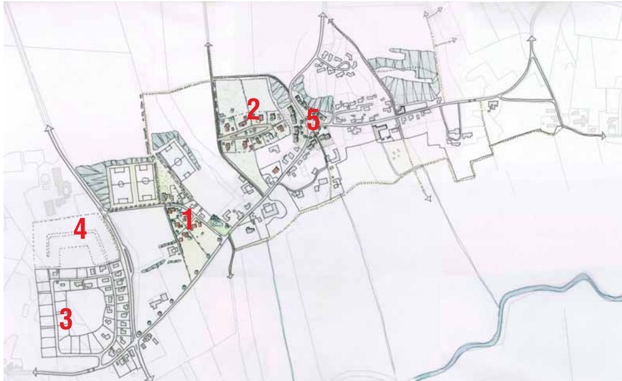
Prioritering af byudviklingsområderne. Område 4 er perspektivområde på langt sigt. Område 5 bliver først aktuelt, hvis savværket lukker.