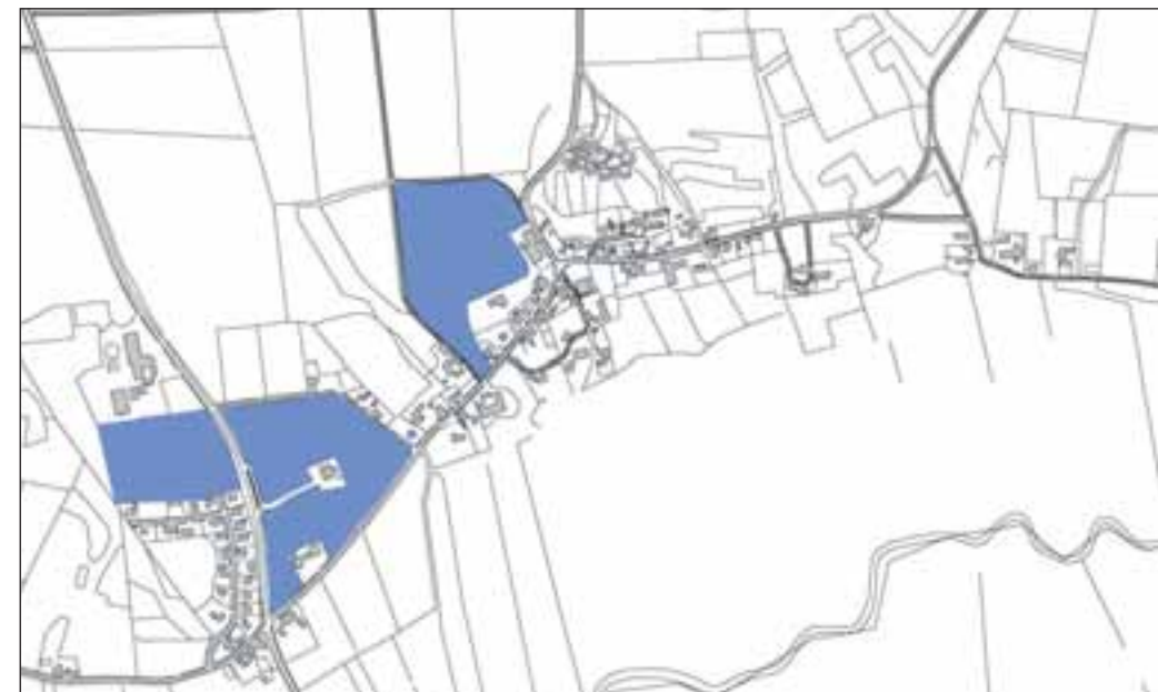
Områder udpeget som potentielle byudviklingsområder.

Mejeriet kunne bruges til "hotel/motel på landet".