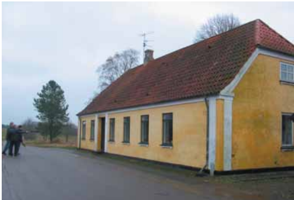
Den gamle skole med de karakteristiske hvide pilastre. Pilastrene findes også på enkelte andre bygninger i byen.