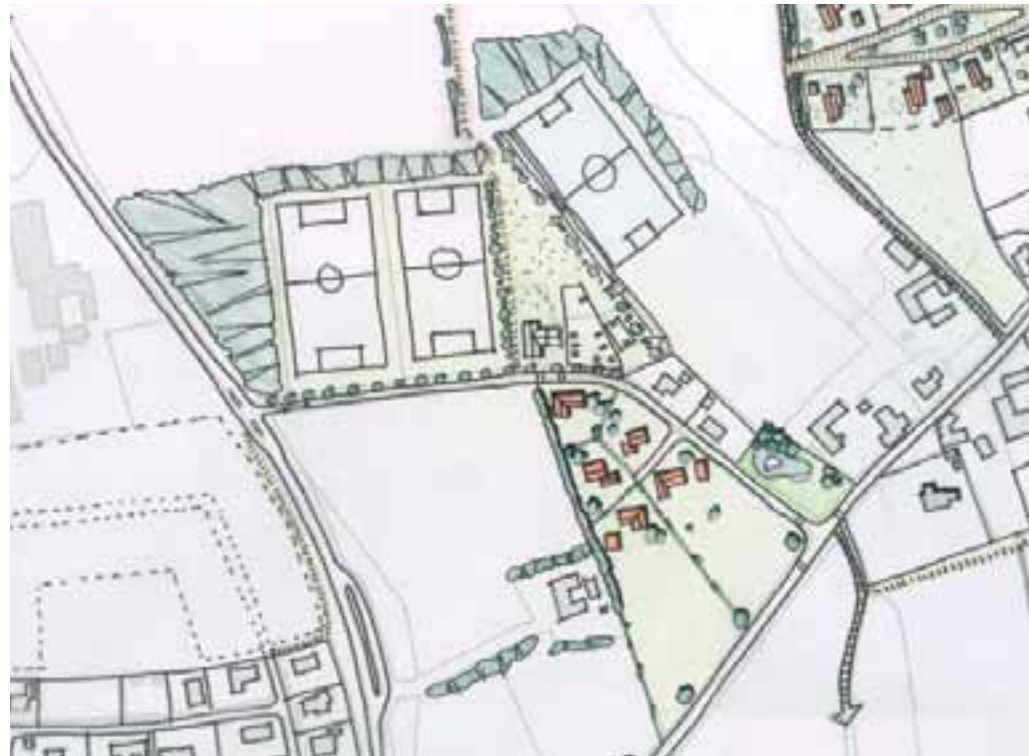
Planudsnit: Ny træningsbane og villaer ved Bakkegården

bliver adgang udefra. Eventuelt kan der også laves bade faciliteter.