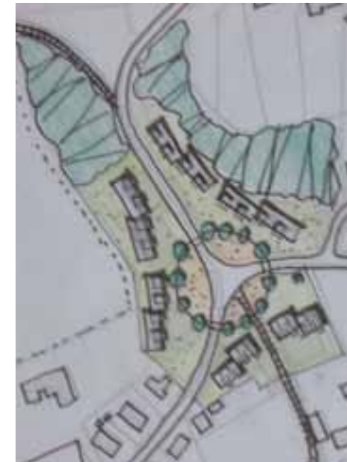
Forslag til pladsdannelse og tæt-lav bebyggelse ved savværket, og alternativ udnyttelse til parcelhuse og byhave.

Den resterende del af området foreslås anvendt til parcelhuse. Der er plads til 10-11 boliger.