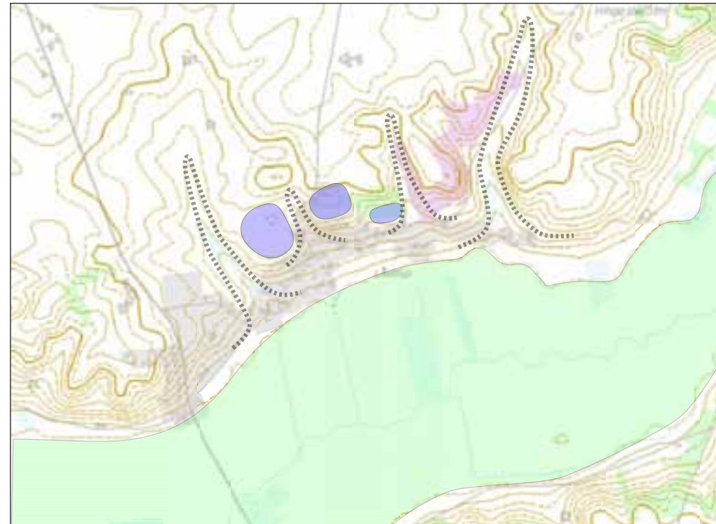
Landskabsanalyse, der viser engarealet (lys grøn), slugterne (stiplede linier) og de flade plateauer i baglandet (blå).

En plan for bedre integration af tilflyttere.