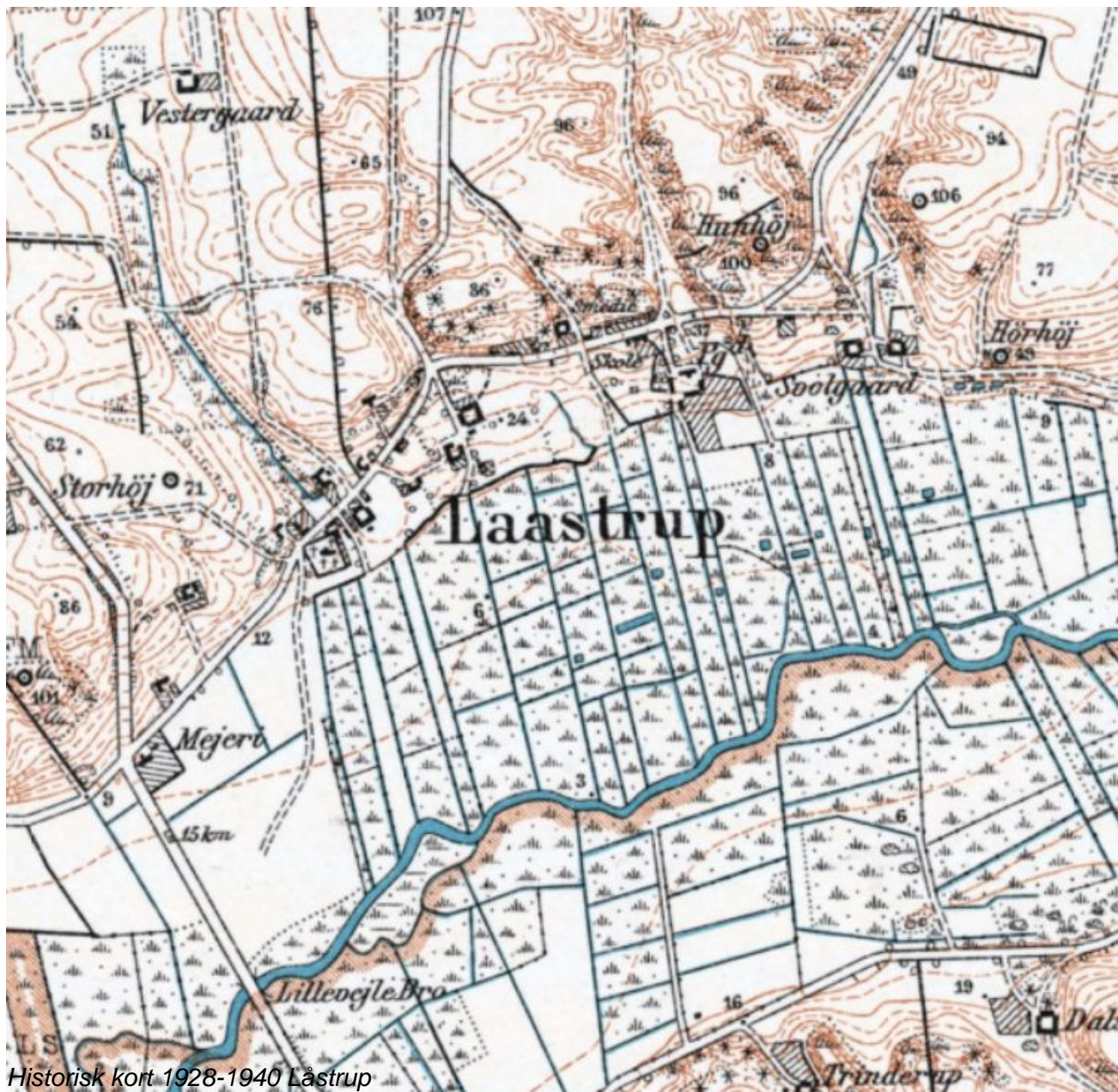
Historisk kort 1928-1940 Låstrup