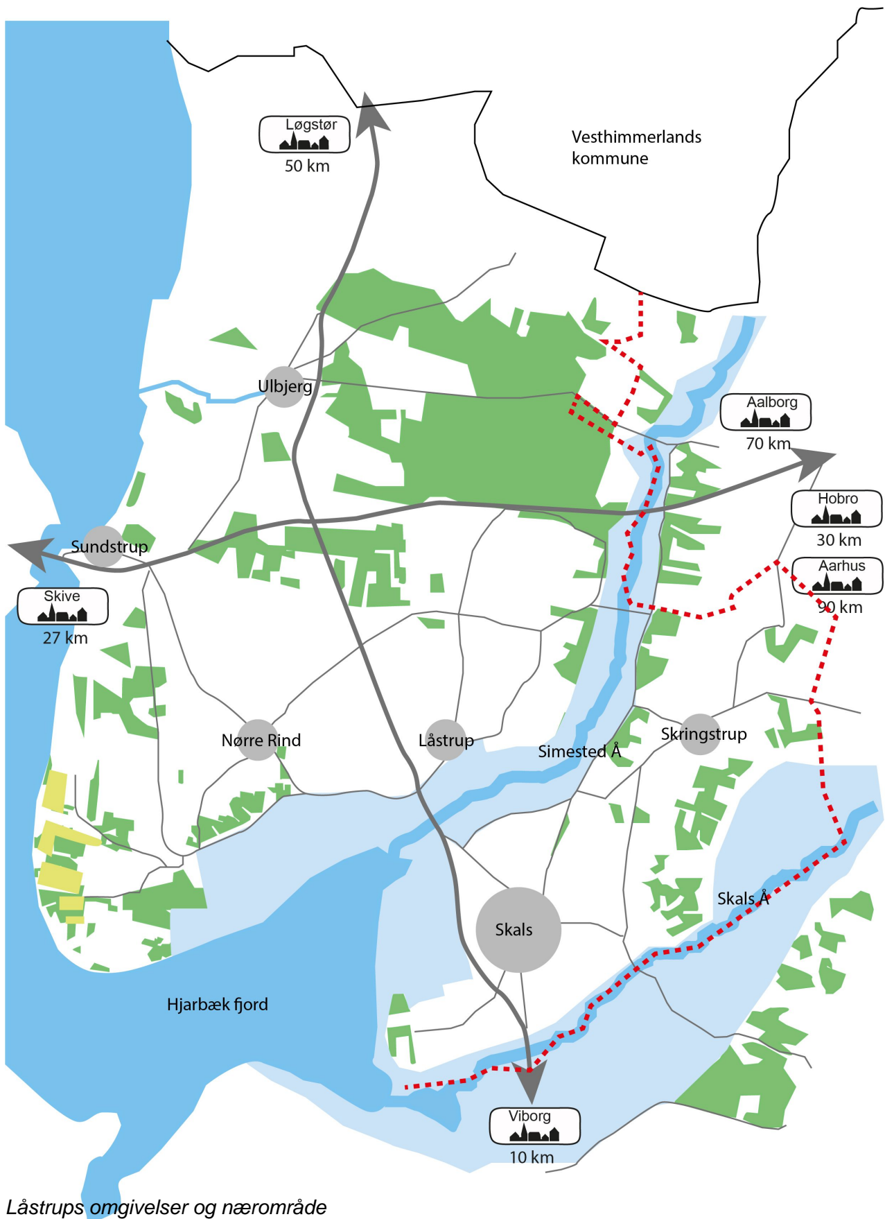
Låstrups omgivelser og nærområde