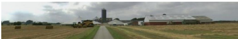
COWI gadefotos 2016, ejendommens bebyggelse set fra øst

Ejendommen ligger i et landbrugslandskab, der ikke i medfør af kommuneplanen har særlige landskabelige eller naturmæssige værdier, som kunne være til hinder for en antennemast her. Mast og teknikkabine placeres ved større landbrugsbygninger, herunder en relativ høj fodersilo.