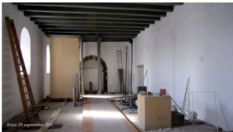
Foto: 29 september 2011