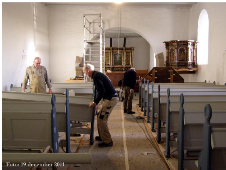
Foto: 19 december 2011

Kirken vil blive genåbnet ved en gudstjeneste søndag den 12. Februar 2012 kl. 10.00 med efterfølgende traktement i Låstrup Forsamlingshus.