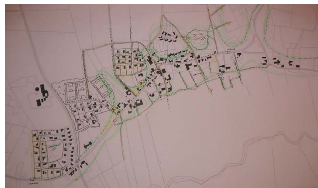
Bruttoplanen, der blev præsenteret på aftenmødet. Den endelige plan afviger på flere punkter.