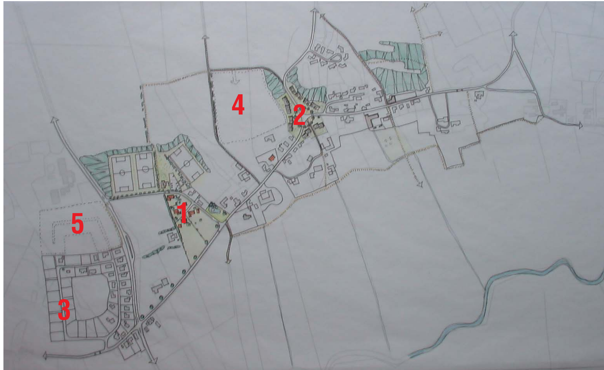
Prioritering af byudviklingsområderne. Område 4 og 5 er perspektivområder på langt sigt.

Endelig prioriteres anlæg af kanolandsningsplads, primitiv teltplads og shelters samt nye toiletter ved Værestedet højt.