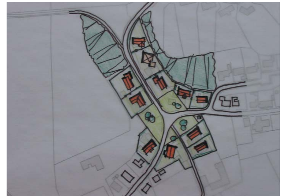
Alternativ udnyttelse af savværket til parcelhuse og byhave.