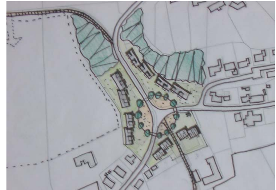
Planudsnit: Forslag til pladسدannelse og tæt-lav bebyggelse ved savværket

Et andet område, hvor der på langt sigt kan ske byudvikling er området nordøst for sportspladsen. Området ligger på et højtliggende plateau, med god udsigt over ådalen.