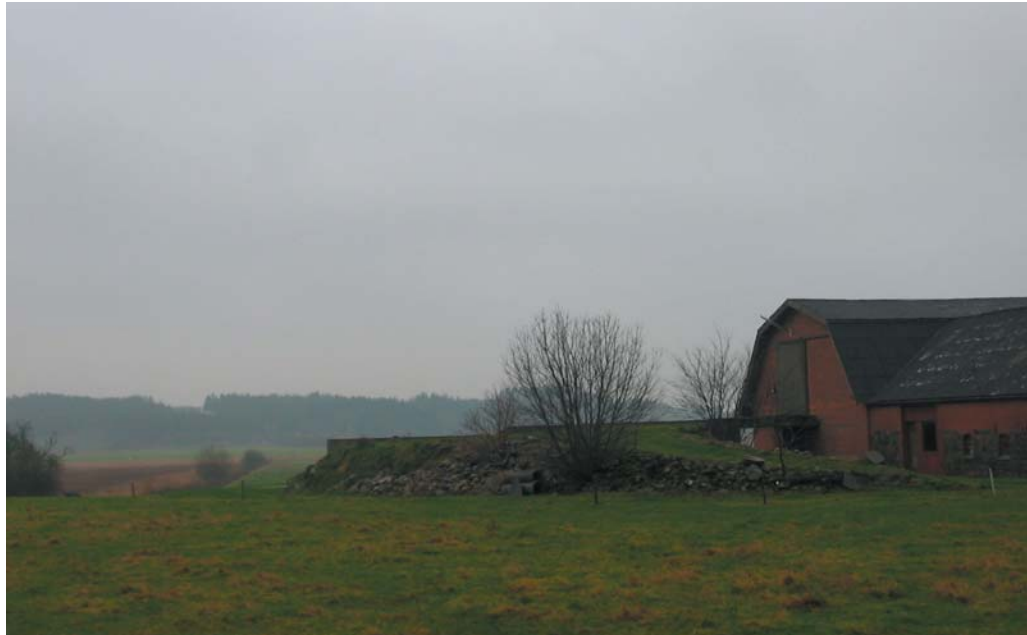
Karakteristisk udsigt over ådalen fra bygaden. De mange åbne kig er et bevaringsværdigt karaktertræk.