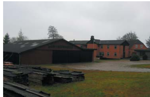
Del af savværket i dag

På savværksgrunden er der skitseret to alternativer. Det ene viser en tæt-lav bebyggelse omkring en cirkulær byplads i selve krydset. Pladsen foreslås belagt med grus, og kranses af en ring af træer. Den tæt-lave bebyggelse kan bygges i træ for at bevare områdets særlige karakter. Ved at bygge tæt-lav på stedet understreges det, at bymidten