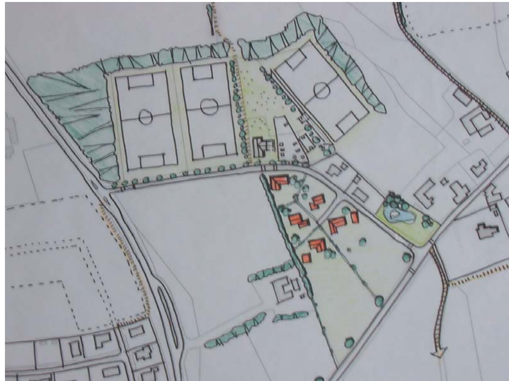
Planudsnit: Ny træningsbane og villaer ved Bakkegården

bliver adgang udefra. Eventuelt kan der også laves bedefaciliteter.