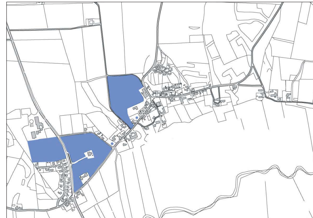
Områder udpeget som potentielle byudviklingsområder.

Mejeriet kunne bruges til "hotel/motel på landet".