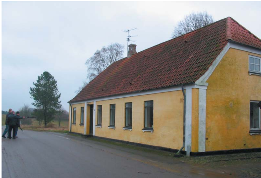
Den gamle skole med de karakteristiske hvide pilastre. Pilastrene findes også på enkelte andre bygninger i byen.